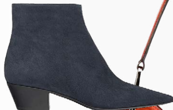
БОТИЛЬОНЫ, MICHEL VIVIEN (RENDEZ-VOUS.RU), ЦЕНА ПО ЗАПРОСУ