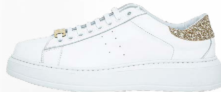
КЕДЫ, PATRIZIA PERE , 19 200 РУБ.