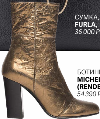
БОТИНКИ, MICHEL VIVIEN ( RENDEZ-VOUS.RU ), 54 390 РУБ.