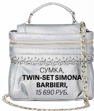
СУМКА, TWIN-SET SIMONA BARBIERI , 15 690 РУБ.

Бронза, золото, серебро – не бойся смешивать аксессуары разных металлических оттенков в одном образе.