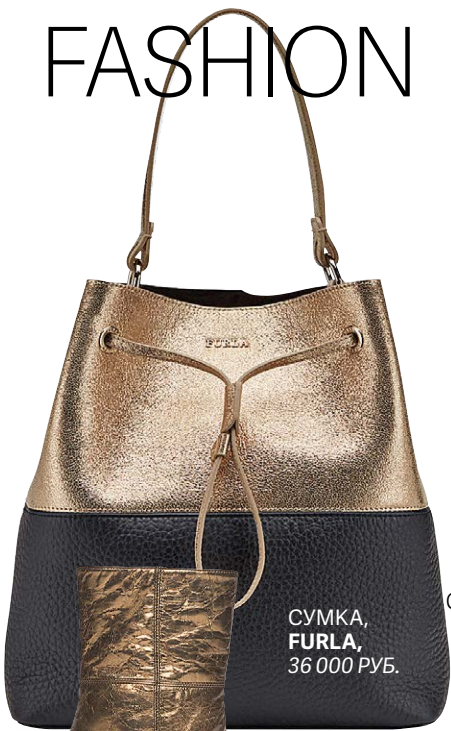
СУМКА, FURLA , 36 000 РУБ.