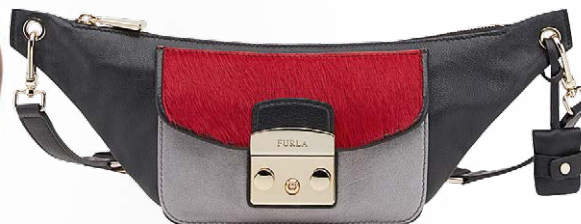
СУМКА, FURLA , 35 000 РУБ.