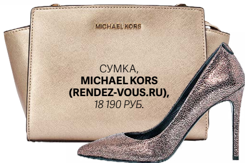
ТУФЛИ, PATRIZIA PEPE , 23 400 РУБ.