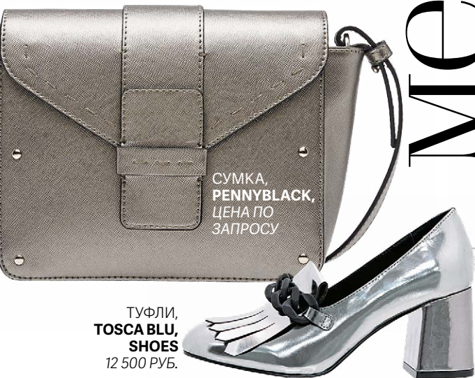
ТУФЛИ, TOSCA BLU , SHOES 12 500 РУБ.