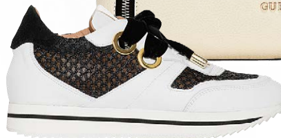
КРОССОВКИ, TWIN-SET SIMONA BARBIERI , ЦЕНА ПО ЗАПРОСУ