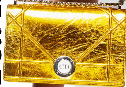
ЮБКА, PINKO ; ТУФЛИ, MANOLO BLAHNIK ; СУМКА, ЗОЛОТОЙ МЕТАЛЛИК, DIOR ; СУМКА, СЕРЫЙ МЕ- ТАЛЛИК, COCCINELLE ; ЧАСЫ, CALVIN KLEIN WATCHES & JEWELRY ; БРАСЛЕТЫ, SUNLIGHT