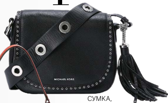
СУМКА, MICHAEL KORS (RENDEZ-VOUS.RU), 40 290 РУБ.