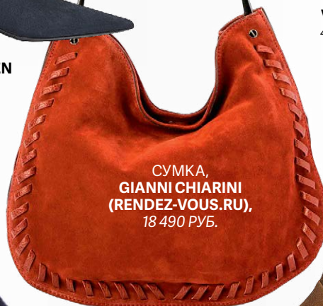
СУМКА, GIANNI CHIARINI (RENDEZ-VOUS.RU), 18 490 РУБ.